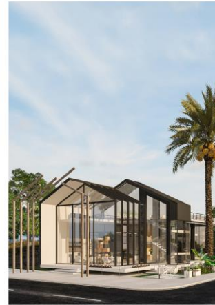
کافی شاپ ورونا

با توجه به موقعیت پروژه و کاربری آن که میل به دیده شدن دارد و از سوی دیگر تمایل فضایی داخلی برای آمیختگی با فضای بیرون تلاش میکند تا از ابرزه بودن به سوی سوزه بودن تغییر وضعیت دهد.