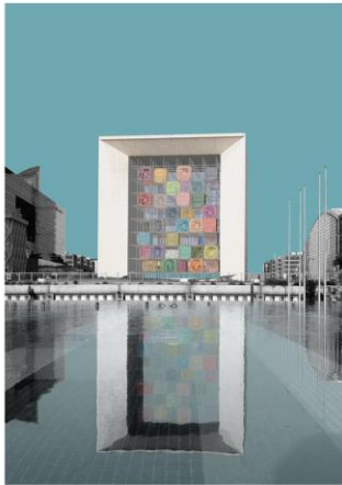
LA DE FENCE

مسابقه معماری بین المللی ArchiHackers در سال ۲۰۱۹ میلادی در کشور ایتالیا برگزار شد و به عنوان طرح برگزیده منتشر شد.