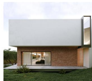
ویلا ۲۰ درجه

پروژه در شرایطی به دفتر ارجاع شد که ۲۴ سال قبل دو فونداسیون در دو زمین مجزا جانمایی شده بود و با توجه به مجوزهای اخذ شده، ویژگی های سایت و درخواست کارفرما مبنی بر وسعت بنا و دستیابی به حداکثر سطح اشغال مجاز، مستلزم ایجاد ارتباط بین دو بنا شدیم تا به بنایی واحد دست پیدا کنیم. با تحلیل و بررسی شرایط بر آن شدیم تا محدودیت ها را تبدیل به یک فرصت کنیم و در نهایت ساختمان به دو بخش عمومی و خصوصی تقسیم شد. قسمت عمومی با فضایی آزاد و ارتفاع سقف بلند در جهت انعطاف پذیری در عملکرد طراحی شده و با چرخش ۲۰ درجه ای به سمت علم کوه، دیالوگی ماندگار بین بنا و کوه برقرار شد و این اتفاق ، ارتباط بصری میان درون و بیرون را نیز فراهم آورده است و در قسمت خصوصی با توجه به نیاز کارفرما عملکرد فضاها شکل گرفت و فضاسازی به گونه ای دیگر رقم خورد تا پاسخ گوی نیاز های افراد باشد. شاید بتوان گفت به گونه ای ۲۰٪ زاینده ی سرتوشی ست که ۲۴ سال پیش برایش رقم خورد. بستر ۲۰ درجه محکوم به ایجاد ارتباط است. ارتباطی ژرف و بی نهایت. هر فضا روش خاص و مستقل خود را برای ارتباط با محیط دارد که در لایه های زیرین آن می توان یک استقلال واحد را یافت.